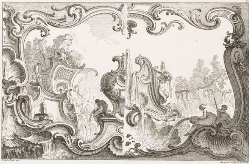
Figura 04 – Ornato 3