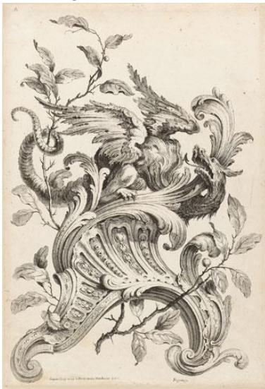
Figura 02 – Ornato 1