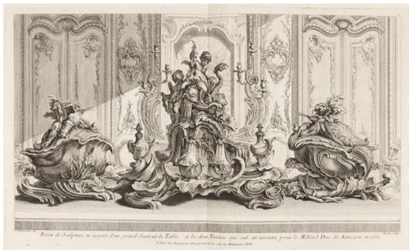
Figura 01- Gravura de Rocaille

O Rococó se desenvolve, em grande parte do século XVIII, como uma espécie de oposição à complexidade formal e aos excessos do Barroco, apelando para a leveza, graça e para os coloridos suaves. O termo tem origem na palavra francesa rocaille (concha) ( FIGURA 01 ) – tipo comum de decoração de jardins do século XVIII, com conchas e rochas – que se populariza por analogia ao termo italiano Barocco . Os alemães se antecipam ao empregar o termo (Rokoko) em sua acepção moderna de estilo artístico referido à arquitetura e artes ornamentais, na segunda metade do século XIX, libertando-o assim do sentido pejorativo que o acompanha, desde a origem até o século XIX (OLIVEIRA, 2003, p. 25).