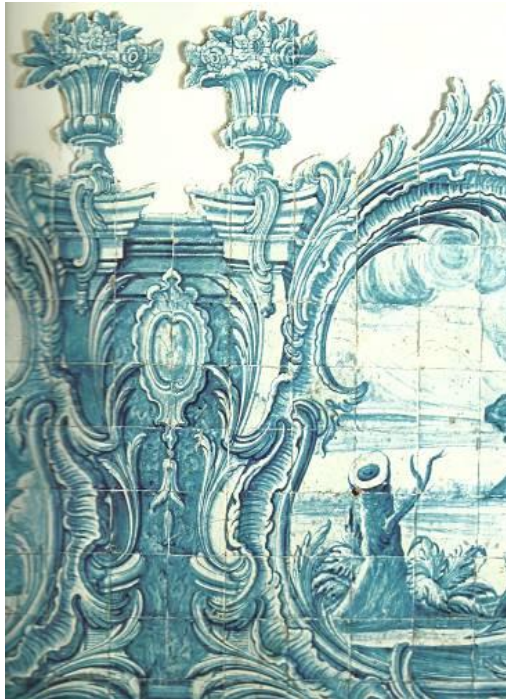
Figura 06 – Moldura – Detalhe painel do Convento e Igreja da Ordem Terceira Carmelita, 1778, Pernambuco.

Lisboa, em 1755, foi devastada por um terremoto. Neste período, o reinado era de D. José I é marcado pelo poder do Secretário de Estado do Reino, Sebastião José de Carvalho e Melo conhecido pelo título, Marquês de Pombal, que governou Portugal entre 1750 e 1777. Para reconstrução de Lisboa, Pombal incentivou a produção de azulejos. Os exemplares desse período são então chamados de Azulejos Pombalinos. Com a morte de D. José I, o reinado foi para as mãos de D. Maria I, que assumiu a liderança de governo. Na azulejaria, os padrões estéticos Barroco/Rococó permaneceram, apenas sua denominação passou a ser “Azulejos estilo D. Maria”.