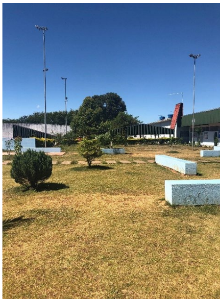
Figura 4: Imagem interna das celas do regime fechado