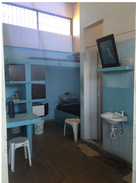
Figura 3: Imagem interna das celas do regime fechado