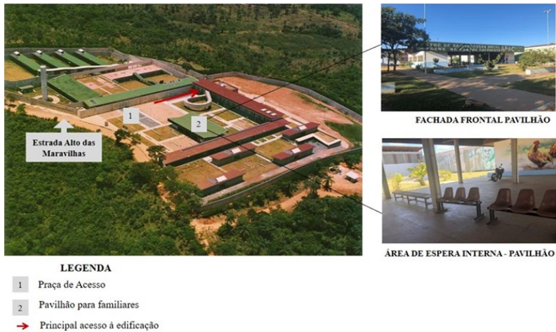
Figura 2: Localização de praça e pavilhão para espera de familiares