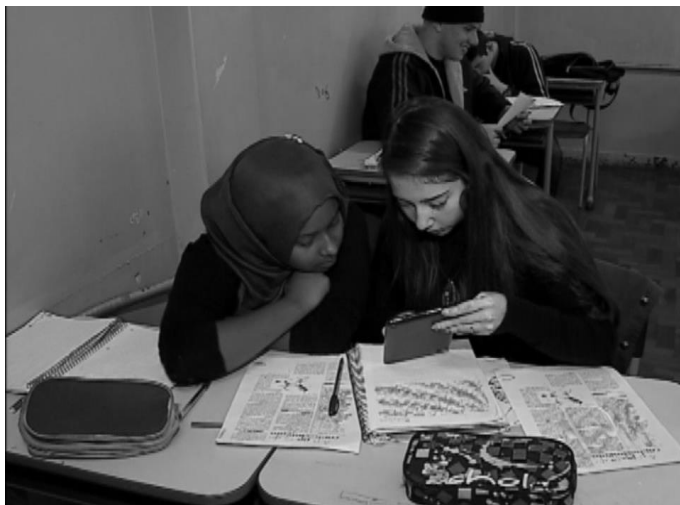
Imigrante bengali em escola em Passo Fundo.

O entrevistado reconhece a dificuldade pedagógica, integrativa e curricular enfrentada pelos professores em várias escolas do município, porém, relativiza essa situação-limite ao afirmar que, “aos poucos, essa realidade vai tomando corpo na vida escolar de Passo Fundo e vamos nos preparando melhor e reduzindo os limites existentes hoje” (Entrevista direta já informada).