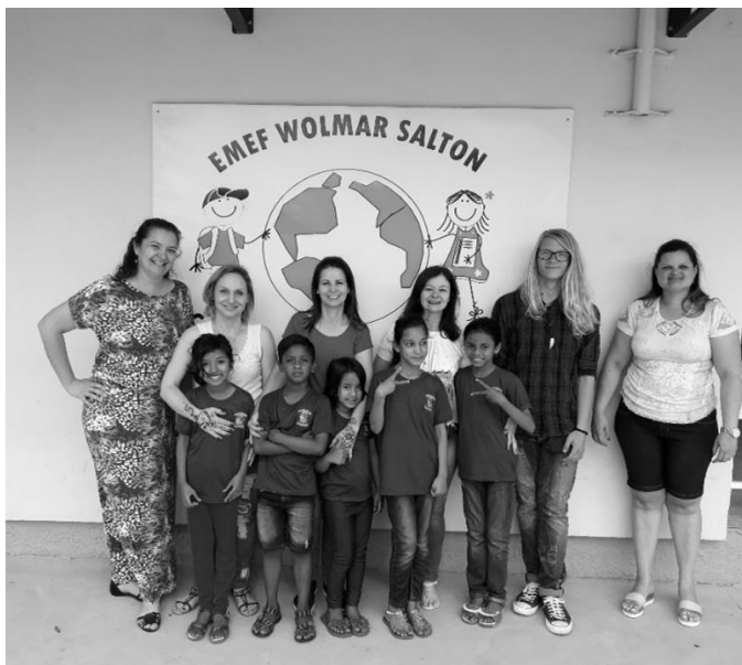
Professores e alunos imigrantes de Bangladesh na Escola Municipal Wolmar Salton em Passo Fundo.

escola, a compromete e a deixa insegura frente aos trâmites legais e mais justos (Magalhães, 2010). Nesse campo da inexistência de uma política de inserção de filhos de imigrantes nas escolas, segundo diretoras entrevistadas, deveria de se fazer presente “alguns professores que falam línguas mais universais como o inglês e o francês que nós aqui não temos; aqui usamos os programas de tradução dos celulares e computadores, mas são complicados e não há tempo e nem paciência para encontrar todas as palavras” (Conversa informal com diretora de uma escola municipal de Passo Fundo). Não houve nenhum treinamento nem orientação prévia por parte dos gestores em educação do município para acolher esses alunos filhos de imigrantes. Como já falamos, isso tudo ficou a cargo dos envolvidos diretamente no processo, fato esse que revela que a esfera pública é a que garante os direitos à educação, mas não viabiliza ações para concretizá-los da melhor forma possível.