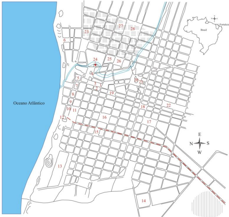
Fig. 1 Mapa de Fortaleza com a localização de prédios e equipamentos públicos a partir da planta desenhada por Adolfo Herbster, em 1875