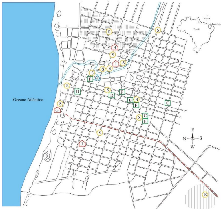
Fig. 3 Mapa com a localização geográfica das festas do Rosário, congos, sambas e maracatus em Fortaleza, nas últimas décadas do século XIX

Para a localização de ruas, praças e equipamentos públicos ver mapas nas figuras 1 e 2