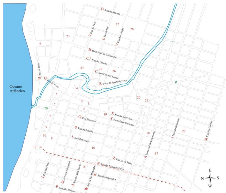
Fig. 2 Mapa de Fortaleza com a localização de vias públicas a partir da planta desenhada por Adolfo Herbster, em 1875