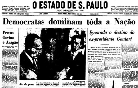
Figura 8: Capa do jornal O Estado de São Paulo de 03 de abril de 1964