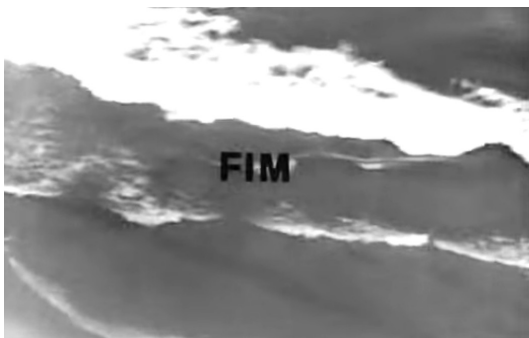
Figura 7: Última sequência: O mar ao som de Villa-Lobos

Apenas que dezoito dias depois, em 31 de março de 1964, militares brasileiros juntos à burguesia industrial, meios de comunicação de massa e setores conservadores da Igreja Católica, amplamente apoiados pelas classes médias urbanas e financiados pelo capital norte-americano, encerraram o governo do presidente João Goulart, e infringiram um golpe de estado civil-militar no Brasil.