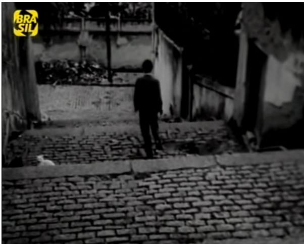
Figura 11: Sequência final de “O Desafio”: Marcelo desce às escadas ao som de “Eu Vivo num Tempo de Guerra”

Diferente da situação apresentada em Deus e o Diabo na Terra do Sol , que profetizava a emancipação do povo rumo à revolução, em O Desafio temos a clara posição política advinda do desvanecimento do ilusório acordo de classes, ideologizado pelo desenvolvimentismo nacionalista, e marcado pelo Golpe. Se antes a esperança era que o “sertão vai virar mar e o mar virar sertão”, agora a música chama à confrontação: “Eu sei que é preciso vencer/ Eu sei que é preciso brigar/ Eu sei que é preciso morrer/ Eu sei que é preciso matar/ É um tempo de guerra/ É um tempo sem sol” .