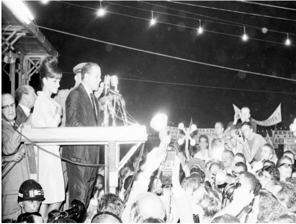
Figura 2: O ex-presidente Goulart discursando no "Comício da Central"

Goulart apresentara, então, as chamadas “Reformas de Base”, um conjunto de medidas estruturais que visavam a superação brasileira do subdesenvolvimento social e econômico. As reformas incluíam proposições para o setor educacional, fiscal, político e agrário. Dentre elas temos: reforma agrária para áreas rurais inexploradas que não cumprissem a função social da propriedade; erradicação do analfabetismo e multiplicação das experiências do Método Paulo Freire; reforma fiscal, limitando os lucros e remessas de empresas multinacionais ao exterior; reforma eleitoral, com o direito de voto aos analfabetos e a legalização do Partido Comunista Brasileiro, ilegal desde 1947 4 .