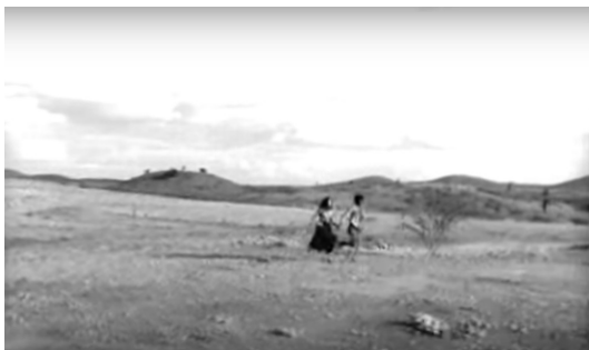
Figura 6: Penúltima sequência: Manoel e Rosa fugindo rumo à libertação

O sertão virou mar: culturas popular e erudita se entrelaçando e se encontrando em um horizonte de superação das estruturas que ao homem oprimem. A utopia da esquerda brasileira pré-64 atingira seu ápice, estético-político.