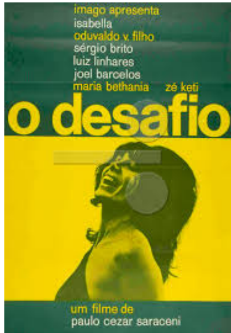
Figura 10: Cartaz de "O Desafio"