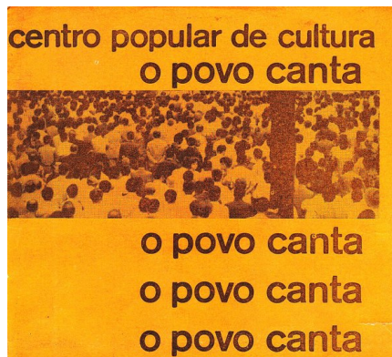
Figura 4: Long-play compacto: O Povo Canta (CPC-UNE/1962)