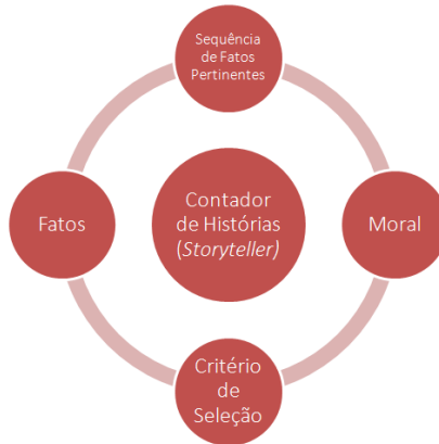
Figura 2 - Storytelling

Para responder a estas perguntas, iremos utilizar a metodologia do storytelling proposta por autores como Delgado (1989) e Ross (1989). De acordo com esta metodologia, os atos normativos, incluindo as sentenças, podem (e devem) ser interpretados como narrativas.